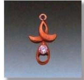
Ю-493 0,08гр. Ø2,6-1шт.