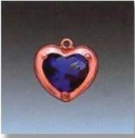
Ю-487 0,09гр. сердце 7x8-1шт.