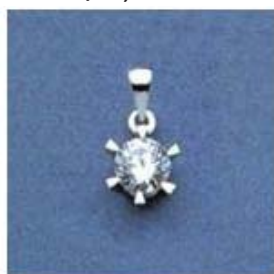
L-146 0,03гр. Ø4,5-1шт.