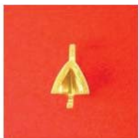
П-279 0,03гр. Ø4,0-1шт.