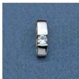
L-1062 0,05гр. Ø3,2-1шт.