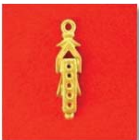
П-174 0,06гр. Ø1,4-5шт.