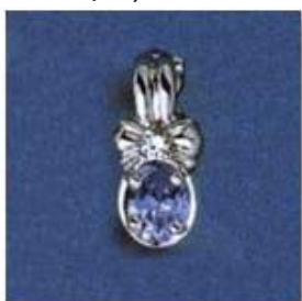
L-140 0,11гр. овал 4,5x6,5-1шт.