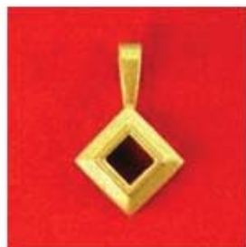
П-218 0,03гр. квадрат 4x4-1шт.