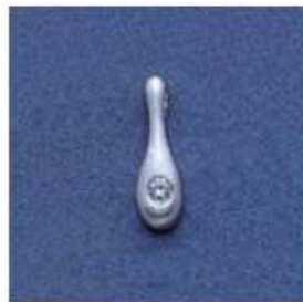
L-114 0,03гр. Ø1,6-1шт.