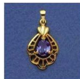
L-198 0,12гр. груша 5,5x7,5-1шт.