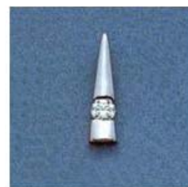
L-1063 0,05гр. Ø3,2-1шт.