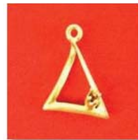
П-133 0,03гр. Ø1,8-1шт.