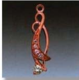
Ю-489 0,16гр. Ø1,3/2; Ø1,6/2; Ø2,6/1