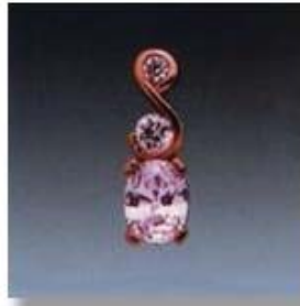
Ю-495 0,11гр. Ø2,2; Ø3,2; овал 5,5x7,5