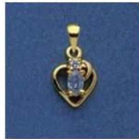
L-1139 0,03гр. овал 2,6x4,5/1;Ø1,8/1