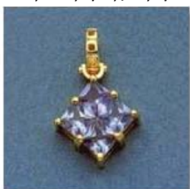
L-1053 0,15гр. квадрат 4,5x4,5-4шт.