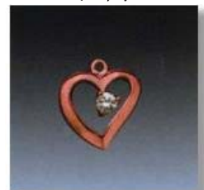
Ю-485 0,08гр. Ø2,6-1шт.