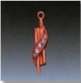
Ю-494 0,07гр. Ø1,1-2шт.; Ø1,3-3шт.