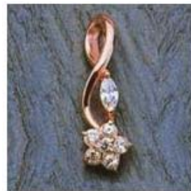
Ю-449 0,08гр. маркиз 2,2x4,5/1;Ø1,8/6