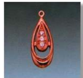
Ю-478 0,1гр.Ø1,6/1;Ø1,7/1; Ø1,8/1