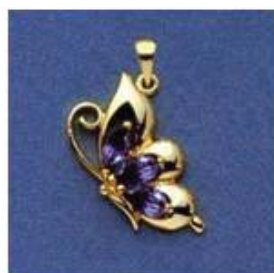
L-197 0,1гр. маркиз 2,6x5,5-3шт.