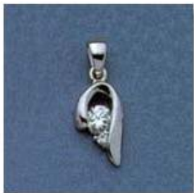
L-18 0,04гр. Ø3,2-1шт.; Ø1,3-1шт.