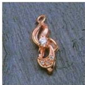
Ю-456 0,06гр. Ø2,6-1шт.; Ø1,0-3шт.