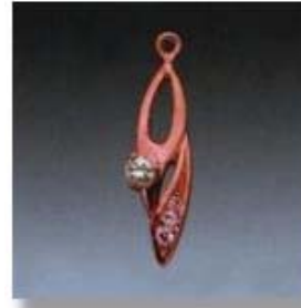
Ю-491 0,1гр. Ø1,3/2; Ø1,1/1; Ø2,2/1