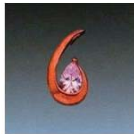
Ю-477 0,14гр. груша 4,5x6,5-1шт.