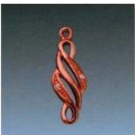
Ю-479 0,10гр. Ø1,1-2шт.