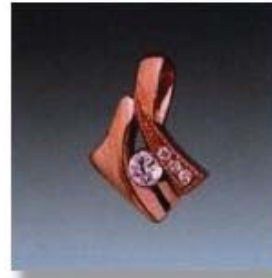
Ю-496 0,1гр. Ø1,2-3шт.; Ø3,2-1шт.