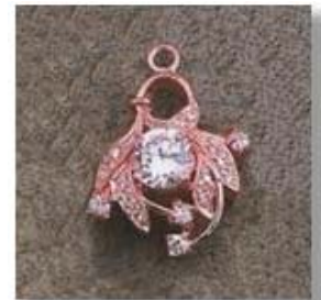
Ю-40 0,12гр.Ø5,5/1;Ø1,8/4; Ø1,0/12