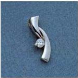
L-1078 0,06гр. Ø2,6-1шт.