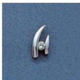
L-1061 0,04гр. Ø2,2-1шт.