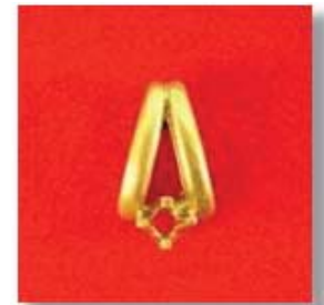
П-105 0,06гр. Ø2,0-1шт.