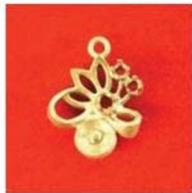
П-369 0,11гр.жемч.5,0/1; Ø2,0/1;Ø1,7/2