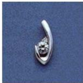
L-101 0,06гр. Ø3,5-1шт.; Ø1,3-1шт.