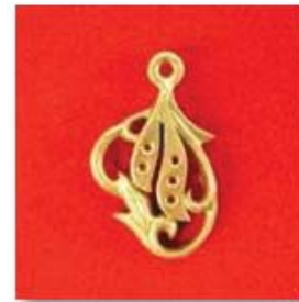
П-104 0,08гр. Ø1.2-5шт.