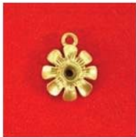
П-364 0,05гр. Ø2,6-1шт.