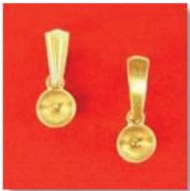
П-21 0,1гр. жемчуг 5,0-1шт.