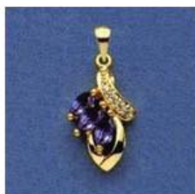
L-195 0,08гр. маркиз 2,8x5,5/3;Ø1,0/4