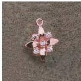
Ю-42 0,05гр. Ø1,6-5шт.