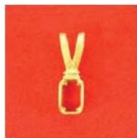
П-277 0,05гр. багет 5,5x3,5-1шт.