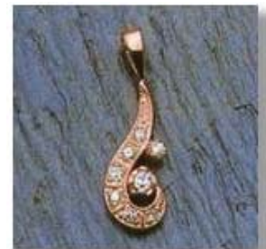
Ю-454 0,06гр.Ø1,8/1;Ø1,3/5; Ø1,0/2