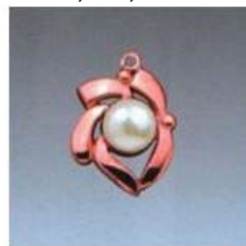
Ю-483 0,13гр. жемчуг 6,0-1шт.