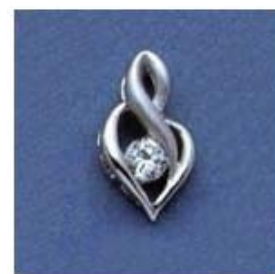
L-163 0,12гр. Ø4,5-1шт.