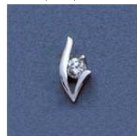
L-1017 0,06гр. Ø3,5-1шт.