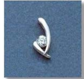
L-1076 0,06гр. Ø3,5-1шт.