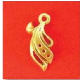
П-41 0,07гр. Ø1,25-3шт.