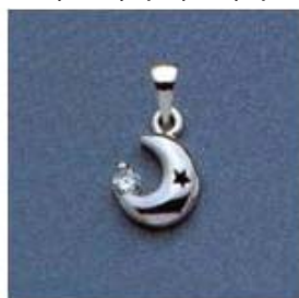
L-1005 0,05гр. Ø2,2-1шт.