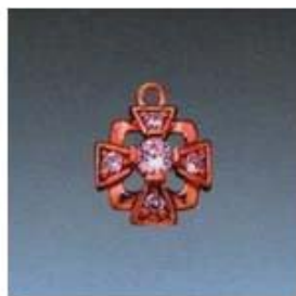
Ю-481 0,11гр. Ø1,8-4шт.; Ø3,2-1шт.