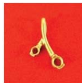
П-278 0,05гр. Ø3,5-1шт.; Ø2,5-1шт.