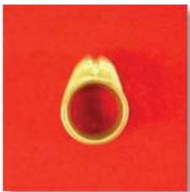
П-106 0,09гр. Ø7,5-1шт.