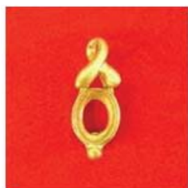
П-291 0,05гр. овал 8x6-1шт.