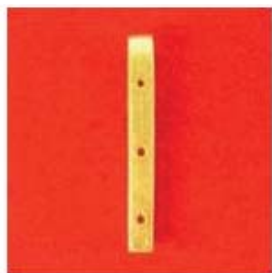
П-217 0,05гр. Ø1,4-3шт.