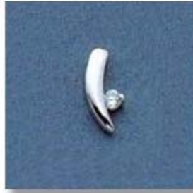
L-1068 0,03гр. Ø2,2-1шт.