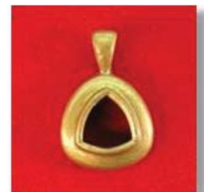
П-216 0,21гр. триллион 8x8 -1шт.