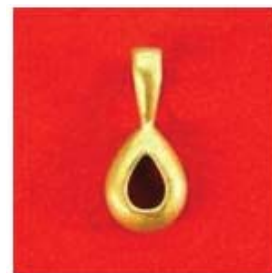
П-220 0,11гр. груша 6x4-1шт.