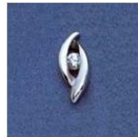
L-116 0,05гр. Ø3,0-1шт.