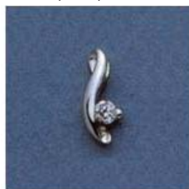
L-1016 0,05гр. Ø2,6-1шт.