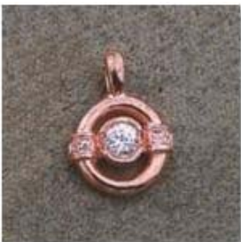
Ю-41 0,09гр. Ø3,6-1шт.; Ø1,0-4шт.