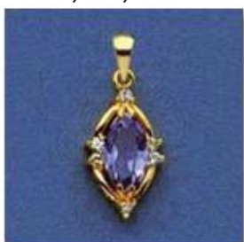
L-192 0,06гр. маркиз 4,5x9/1;Ø1,3/6