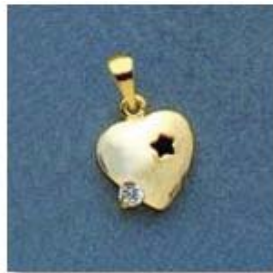
L-1106 0,07гр. Ø2,2-1шт.