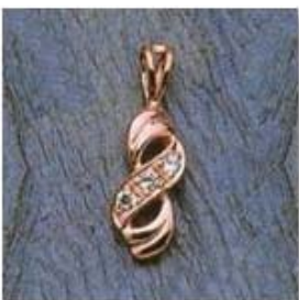
Ю-455 0,05гр. Ø1,6-3шт.