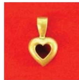
П-214 0,11гр. сердце 4x4-1шт.