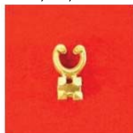
П-292 0,05гр. Ø3,0-1шт.