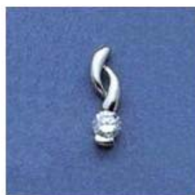
L-159 0,03гр. Ø3,6-1шт.