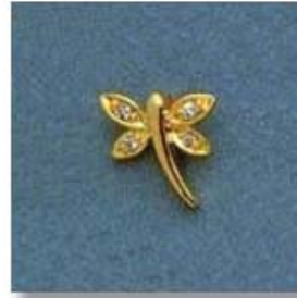
L-1070 0,03гр. Ø1,0-2шт.; Ø1,3-2шт.