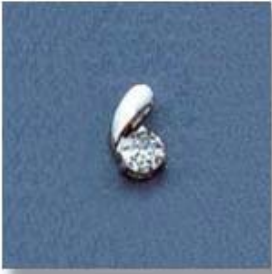
L-1066 0,03гр. Ø3,5-1шт.