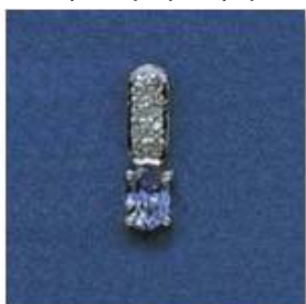
L-220 0,04гр. овал 3,6x5,5/1;Ø1,0/8