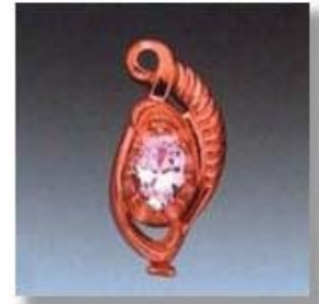
Ю-497 0,15гр. овал 4,5x6,5-1шт.