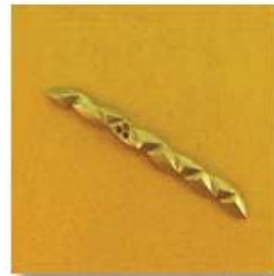
3-251(ю) 0,22гр. Ø1,5-3шт.