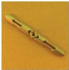
3-252(ю) 0,21гр. Ø2,3-1шт.