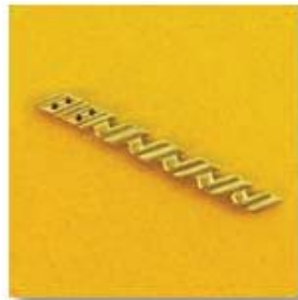
3-250(ю) 0,27гр. Ø1,4-4шт.